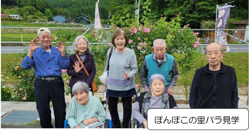
ぼんぼこの里バラ見学