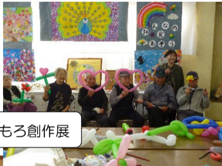
菊花展・もろもろ創作展