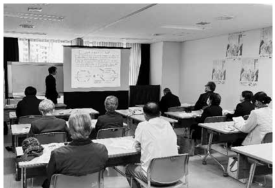
山口保護観察所にて研修を受けている様子

今後の相談員としての活動において、活用していくことができる、多くの知識を学んだ有意義な視察研修となりました。