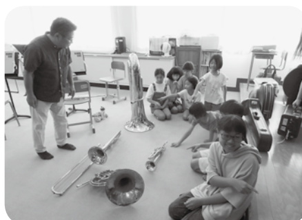
↑みとうっこひろば（楽器体験）