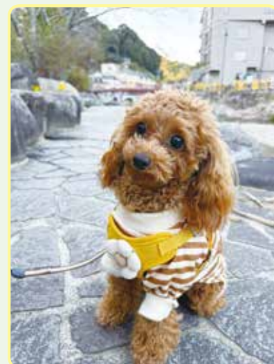
シェリー 令和6年1月生 長門市 温泉街でおさんぽ