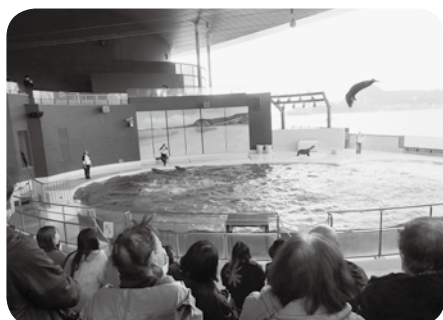
↑障害者とボランティアの集い