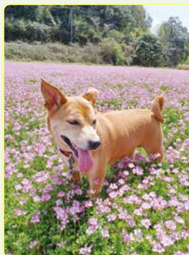
ナナちゃん 美祿市 こたつ大好き我が家のぐうたらワンコ