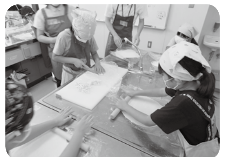
↑みとうっこひろば（うどん作り）