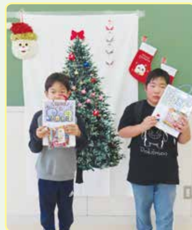
みねっ子〜クリスマスの巻〜 メリークリスマス 🎅