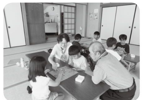
↑みとうっこひろば（将棋）