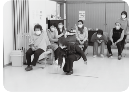
↑クリスマス会（モルック）