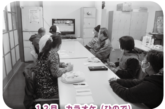
12月 カラオケ（ひので）