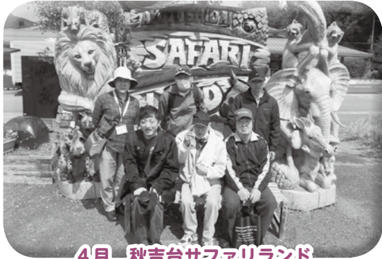
4月 秋吉台サファリランド

ひまわりサロン（精神保健サロン）は、精神障がいのある方の社会参加と地域交流、居場所づくりを目的として定期的に開催しています。