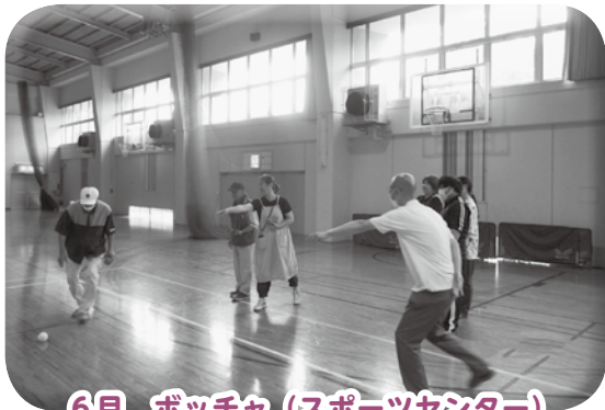
6月 ポッチャ（スポーツセンター）