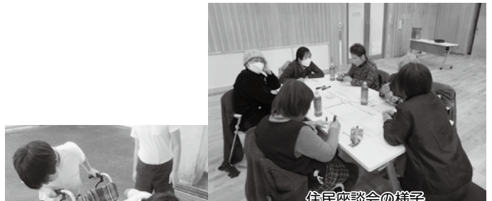
住民座談会の様子