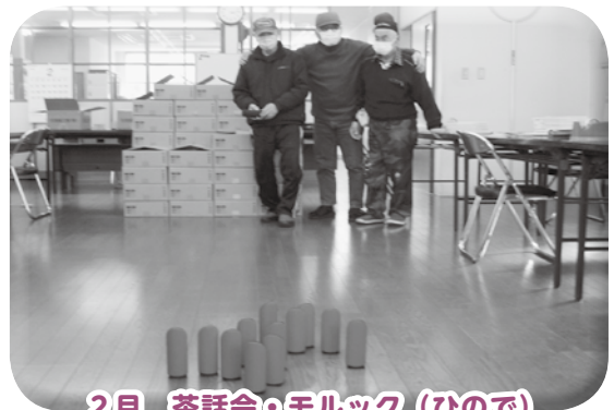
2月 茶話会・モルック（ひので）