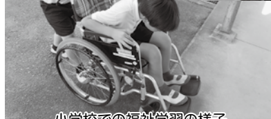
小学校での福祉学習の様子