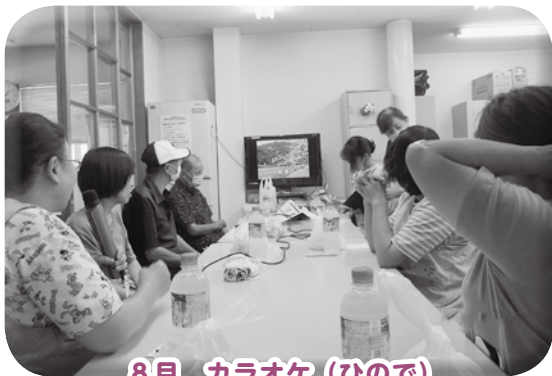
8月 カラオケ（ひので）